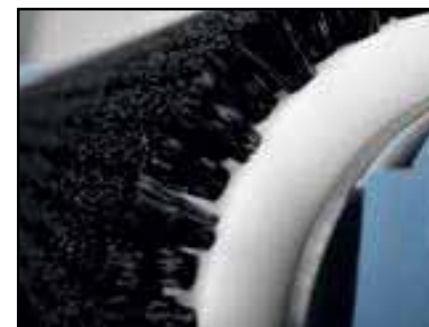
Brosse nylon dure