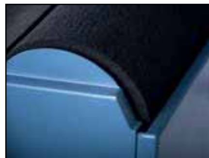
Roue de fartage LONGLIFE : 10 000 passages