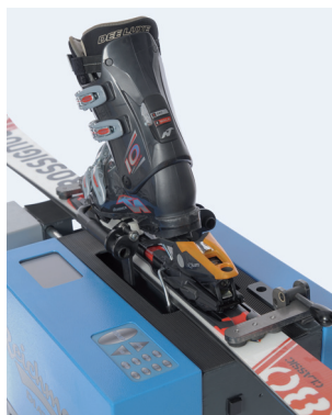
Präzise und ergonomische Dateneingabe