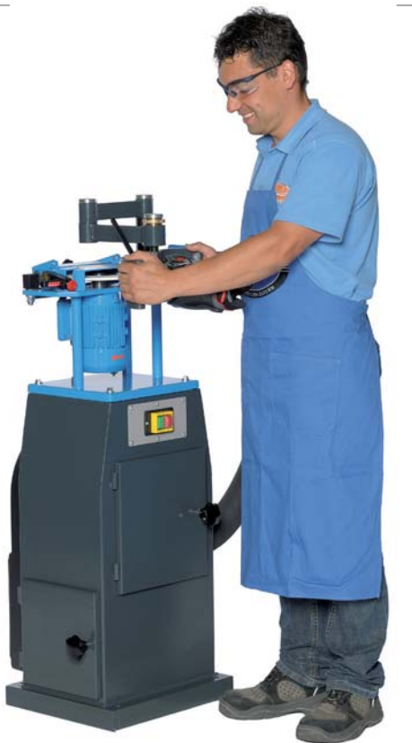
Exzentrerspanneinrichtung an den Kufen