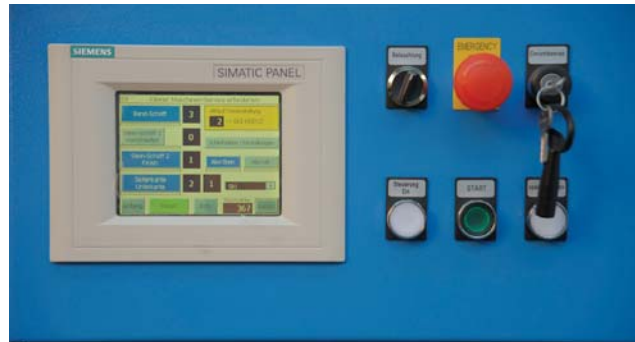
Touch-Screen-Monitor - modern und einfach zu bedienen