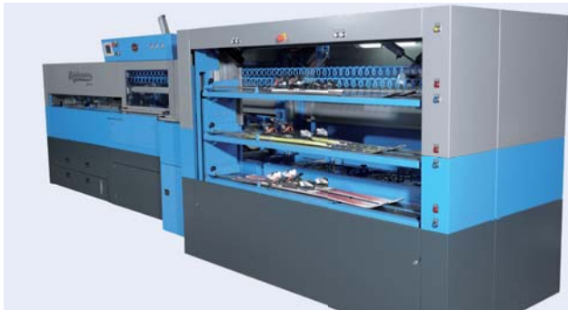
Optional mit Be- und Entlademagazin für bessere Zeiteffizienz