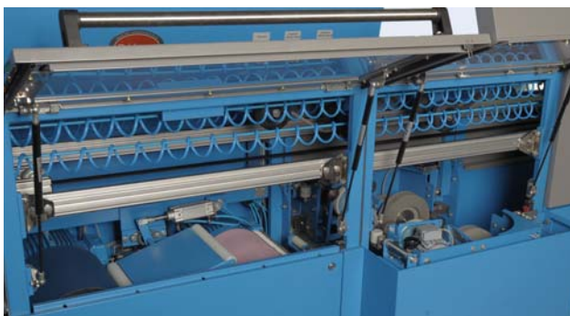
Präziser Band- und Steinschliff für perfekten Belag in einem Schritt