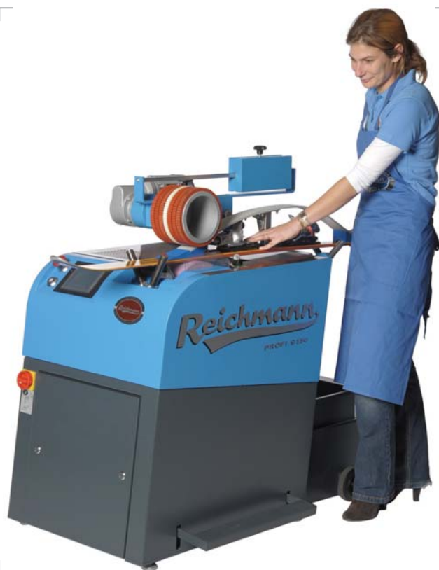
Maschinenbedienung über das leicht bedienbare Touchpanel