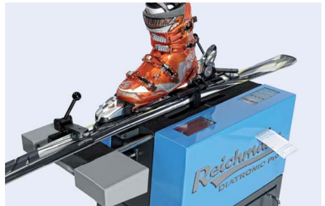
All-in-One Lösung mit integriertem Drucker